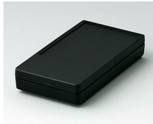
A9070219 DATEC-POCKET-BOX S PMMA (IR) (UL 94 HB) black RAL 9005 85x46x16mm IP 54