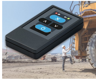
Radio transmitter for machines