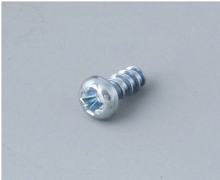
A0304031 Self-tapping screws 2.2 x 5 mm (PZ1)