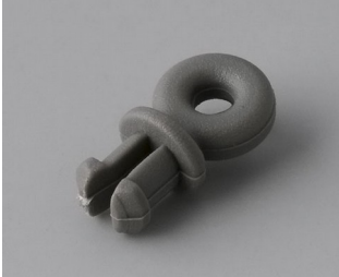
A9100001 Ring eyelet PA 6 volcano