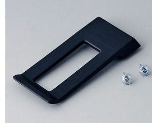
A9172109 Belt/Pocket clip ABS (UL 94 HB) black RAL 9005 62x30mm