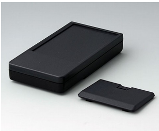
A9072229 DATEC-POCKET-BOX L PMMA (IR) (UL 94 HB) black RAL 9005 120x65x22mm IP 41