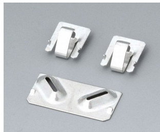
A9190002 Set of battery clips, 2xN/2xAA/2xAAA Steel tin-plated