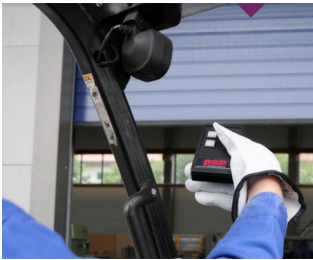
IR remote control for harsh environments