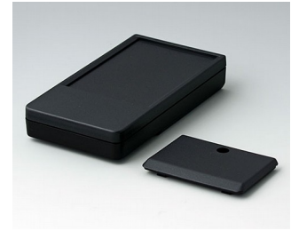
A9072219 DATEC-POCKET-BOX L PMMA (IR) (UL 94 HB) black RAL 9005 120x65x22mm IP 54