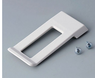
A9172107 Belt/Pocket clip ABS (UL 94 HB) off-white RAL 9002 62x30mm