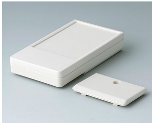
A9071117 DATEC-POCKET-BOX M ABS (UL 94 HB) off-white RAL 9002 105x58x18.5mm IP 54