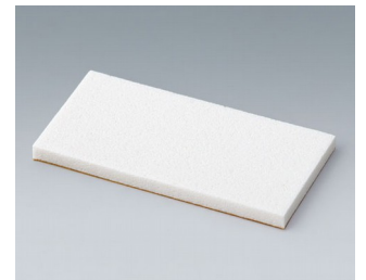
A9250251 Battery spacer PE foam 50x25x3mm