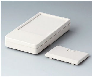
A9072127 DATEC-POCKET-BOX L ABS (UL 94 HB) off-white RAL 9002 120x65x22mm IP 41