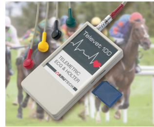
Telemetric ECG system for veterinary medicine