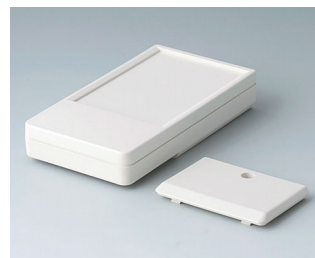
A9072117 DATEC-POCKET-BOX L ABS (UL 94 HB) off-white RAL 9002 120x65x22mm IP 54