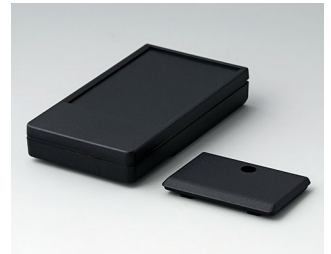
A9071219 DATEC-POCKET-BOX M PMMA (IR) (UL 94 HB) black RAL 9005 105x58x18.5mm IP 54