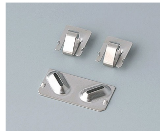
A9190003 Set of battery clips, 2xN/2xAA/2xAAA Steel nickel-plated