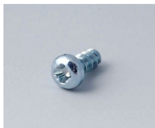
A0305031 Self-tapping screws 2.5 x 6 mm (PZ1)