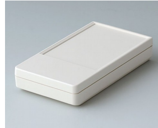
A9070117 DATEC-POCKET-BOX S ABS (UL 94 HB) off-white RAL 9002 85x46x16mm IP 54