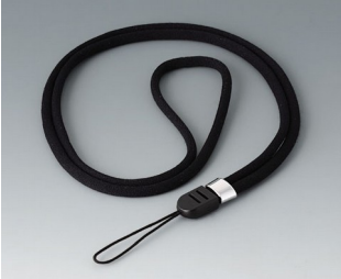
B9100063 Carrying strap, textile lanyard black 860mm