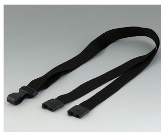
B9100073 Carrying strap, textile lanyard black 914x16mm