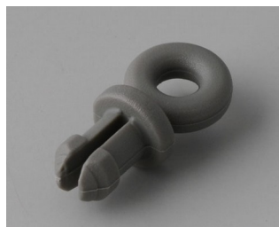
A9100002 Ring eyelet PA 6 volcano