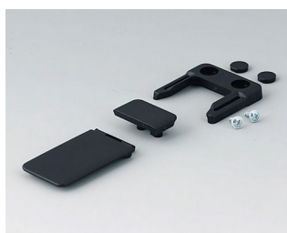
A9152049 Combi-Clip ABS (UL 94 HB) black RAL 9005 45x27mm