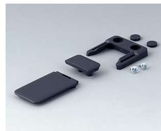
A9152048 Combi-Clip ABS (UL 94 HB) lava 45x27mm