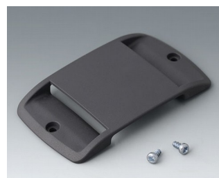
B9106128 Strap eyelet ABS (UL 94 HB) lava