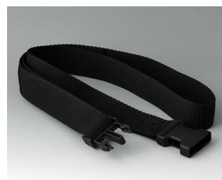
B7110139 Belt strap black 1200x30mm