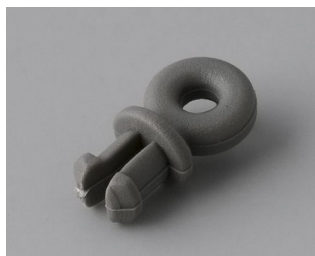
A9100001 Ring eyelet PA 6 volcano