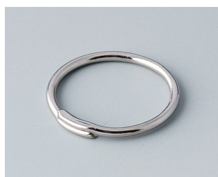
A9164001 Key ring Steel nickel-plated 20.5mm