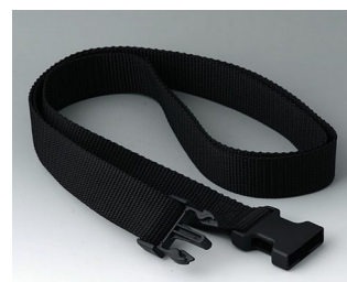
B7110149 Belt strap black 1500x30mm