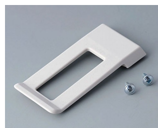
A9172107 Belt/Pocket clip ABS (UL 94 HB) off-white RAL 9002 62x30mm