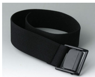
B7110129 Belt strap black 450x35mm