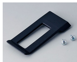
A9172109 Belt/Pocket clip ABS (UL 94 HB) black RAL 9005 62x30mm