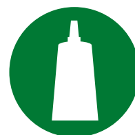
制备 / 组装