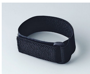
B9100033 Wrist strap black 280mm