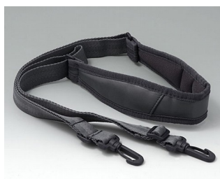
B4308650 Shoulder strap grey 1400mm