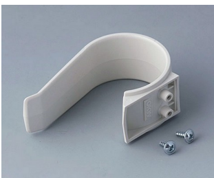
A9167027 Holding clamp PA 6 (UL 94 HB) off-white RAL 9002