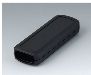
B2824109 CONNECT S ASA+PC (UL 94 V-0) black RAL 9005 120x42x22mm