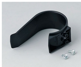
A9167029 Holding clamp PA 6 (UL 94 HB) black RAL 9005