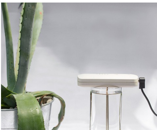
Tool for making colloidal silver solutions