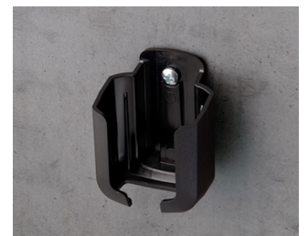
B2921509 Holder S ASA+PC (UL 94 V-0) black RAL 9005