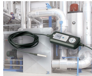
Process monitoring with temperature sensor