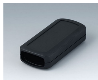
B2823109 CONNECT S ASA+PC (UL 94 V-0) black RAL 9005 90x42x22mm