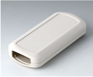
B2833107 CONNECT M ASA+PC (UL 94 V-0) off-white RAL 9002 116x54x22mm