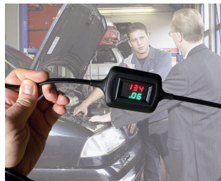
Voltage and current display during trickle charging