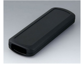
B2834109 CONNECT M ASA+PC (UL 94 V-0) black RAL 9005 156x54x22mm