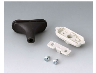
B2911329 Cable gland kit, 5.0 - 5.9 TPE black RAL 9005