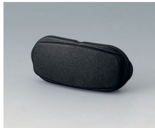
B2811209 End part ASA+PC (UL 94 V-0) black RAL 9005