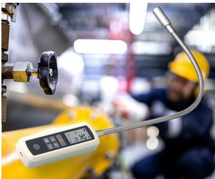
Gas leak detector