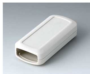
B2823107 CONNECT S ASA+PC (UL 94 V-0) off-white RAL 9002 90x42x22mm