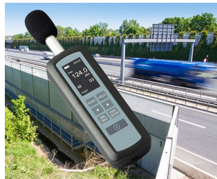
Noise level measurement