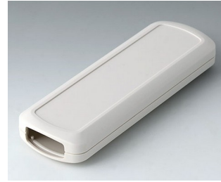
B2834107 CONNECT M ASA+PC (UL 94 V-0) off-white RAL 9002 156x54x22mm