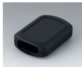
B2832109 CONNECT M ASA+PC (UL 94 V-0) black RAL 9005 76x54x22mm