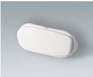
B2811207 End part ASA+PC (UL 94 V-0) off-white RAL 9002