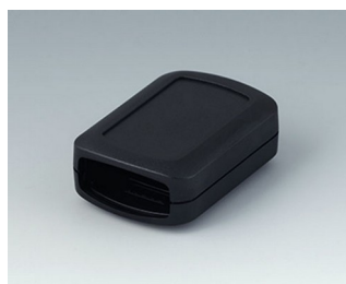
B2822109 CONNECT S ASA+PC (UL 94 V-0) black RAL 9005 60x42x22mm