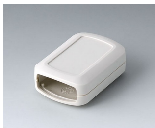
B2822107 CONNECT S ASA+PC (UL 94 V-0) off-white RAL 9002 60x42x22mm