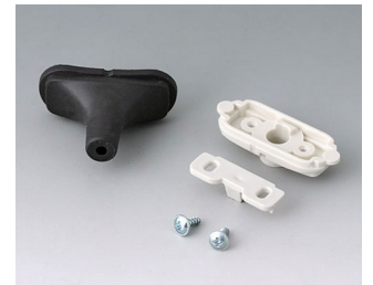
B2911309 Cable gland kit, 3.4 - 4.2 TPE black RAL 9005