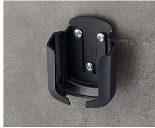
B2931509 Holder M ASA+PC (UL 94 V-0) black RAL 9005