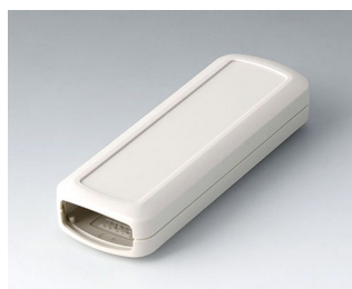
B2824107 CONNECT S ASA+PC (UL 94 V-0) off-white RAL 9002 120x42x22mm