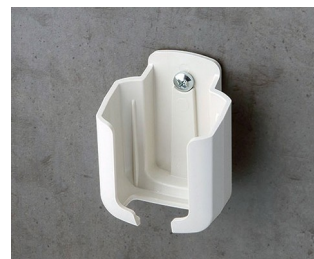
B2921507 Holder S ASA+PC (UL 94 V-0) off-white RAL 9002