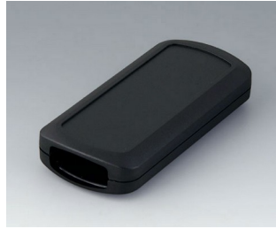
B2833109 CONNECT M ASA+PC (UL 94 V-0) black RAL 9005 116x54x22mm