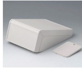
B4056227 UNITEC M, 1.4/0.6 ABS (UL 94 HB) off-white RAL 9002 148x210x80mm IP 40