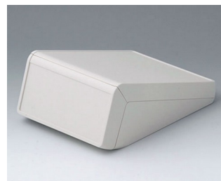
B4056127 UNITEC M, 1.4/0.6 ABS (UL 94 HB) off-white RAL 9002 148x210x80mm IP 40