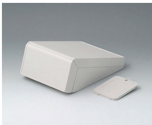
B4054207 UNITEC S, 0.6/0.6 ABS (UL 94 HB) off-white RAL 9002 125x177x69mm IP 40