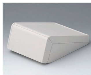
B4056137 UNITEC M, 0.6/1.4 ABS (UL 94 HB) off-white RAL 9002 148x210x80mm IP 40