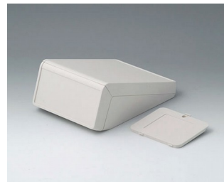
B4054327 UNITEC S, 1.4/0.6 ABS (UL 94 HB) off-white RAL 9002 125x177x69mm IP 40