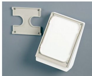
B4156307 Wall suspension element M off-white RAL 9002