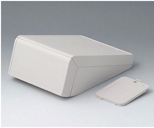
B4056207 UNITEC M, 0.6/0.6 ABS (UL 94 HB) off-white RAL 9002 148x210x80mm IP 40