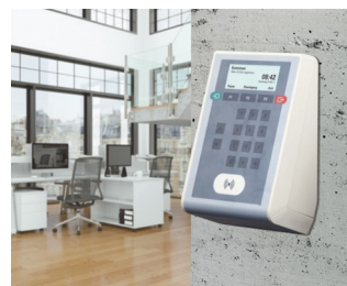
Time recording terminal