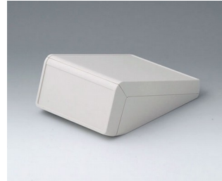
B4054127 UNITEC S, 1.4/0.6 ABS (UL 94 HB) off-white RAL 9002 125x177x69mm IP 40