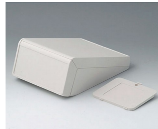
B4056327 UNITEC M, 1.4/0.6 ABS (UL 94 HB) off-white RAL 9002 148x210x80mm IP 40