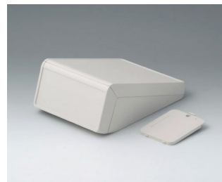
B4054227 UNITEC S, 1.4/0.6 ABS (UL 94 HB) off-white RAL 9002 125x177x69mm IP 40