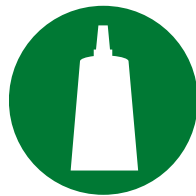
制备 / 组装