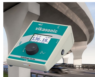
Ultrasonic measuring device