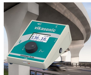
Ultrasonic measuring device