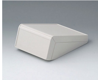
B4054117 UNITEC S, 1.4/1.4 ABS (UL 94 HB) off-white RAL 9002 125x177x69mm IP 40