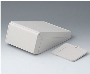
B4056307 UNITEC M, 0.6/0.6 ABS (UL 94 HB) off-white RAL 9002 148x210x80mm IP 40