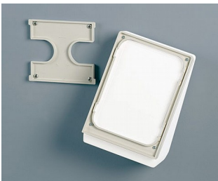
B4154307 Wall suspension element S off-white RAL 9002