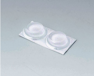
A9212330 Anti-slide feet 12 x 3.5 mm transparent