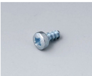
A0306031 Self-tapping screws 3 x 6 mm (PZ1)