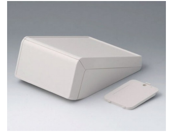
B4056237 UNITEC M, 0.6/1.4 ABS (UL 94 HB) off-white RAL 9002 148x210x80mm IP 40