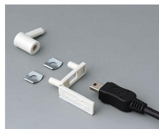
A9320207 USB cover, type Mini-USB PP off-white RAL 9002 29.5x8.5mm