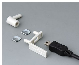
A9320207 USB cover, type Mini-USB PP off-white RAL 9002 29.5x8.5mm