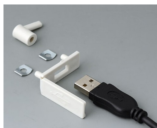
A9320107 USB cover PP off-white RAL 9002 35x13mm