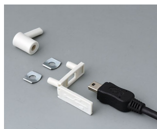
A9320207 USB cover, type Mini-USB PP off-white RAL 9002 29.5x8.5mm