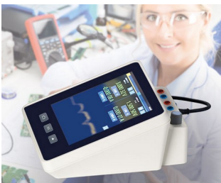
Multimeter measuring device