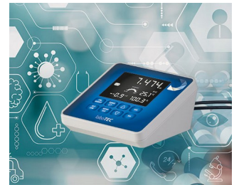
Laboratory measuring device