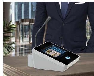
Table microphone / inter phone