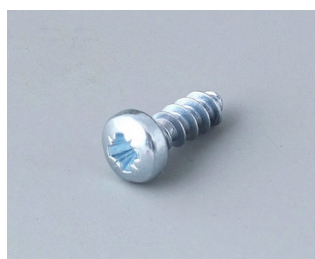
A0308031 Self-tapping screws 3 x 8 mm (PZ1)