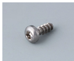
A0308132 Self-tapping screw 3 x 8 mm (T10) Stainless steel