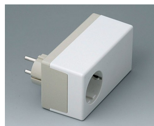
A9022465 PLUG CASE D, Vers. II PC+ABS (UL 94 V-0) pebble grey RAL 7032 120x65x55mm