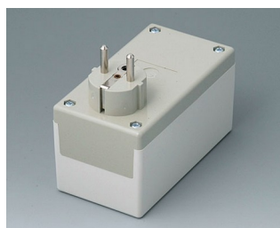
A9021665 PLUG CASE F / D, Vers. I PC+ABS (UL 94 V-0) pebble grey RAL 7032 120x65x65mm