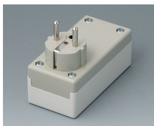
A9011665 PLUG CASE F / D, Vers. I PC+ABS (UL 94 V-0) off-white RAL 9002 100x50x40mm