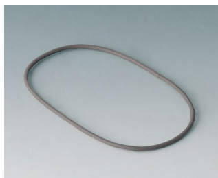
B4708920 Seal S