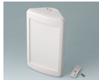
B4610207 SMART-CONTROL M, Vers. II ASA+PC (UL 94 V-0) off-white RAL 9002 173x101x59mm IP 40, IP 55 opt.