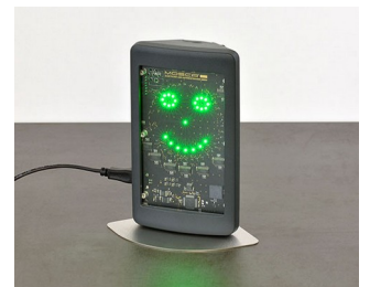
Room air measuring device