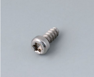
A0325060 Self-tapping screw 2.5 x 6 mm (T8) Stainless steel