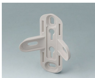
B4705907 Wall suspension element ASA+PC (UL 94 V-0)