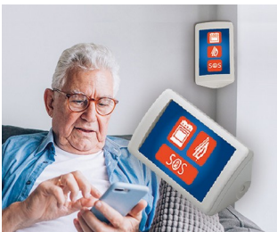
AAL assistance system