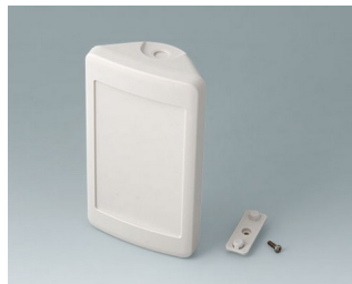
B4608207 SMART-CONTROL S, Vers. II ASA+PC (UL 94 V-0) off-white RAL 9002 142x81x46mm IP 40, IP 55 opt.