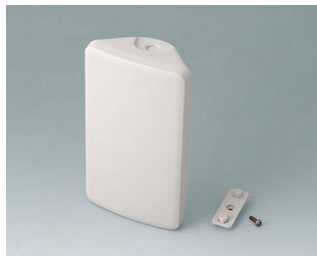
B4608107 SMART-CONTROL S, Vers. I ASA+PC (UL 94 V-0) off-white RAL 9002 142x81x46mm IP 40, IP 55 opt.