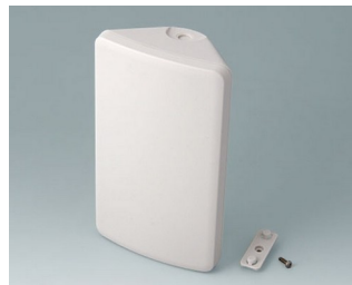
B4610107 SMART-CONTROL M, Vers. I ASA+PC (UL 94 V-0) off-white RAL 9002 173x101x59mm IP 40, IP 55 opt.