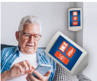
AAL assistance system