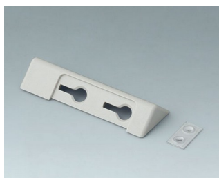
B4705207 Desktop stand set ASA+PC (UL 94 V-0)