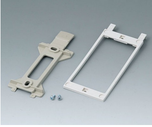
B1360048 Wall suspension elements ABS (UL 94 HB) pebble grey RAL 7032