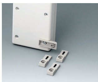
A9204108 Wall mounting brackets PA 6 pebble grey RAL 7032