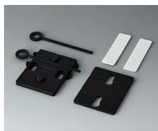
A9305019 Wall suspension elements ASA+PC (UL 94 V-0) black RAL 9005