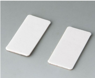
A9305147 Adhesive foil holder